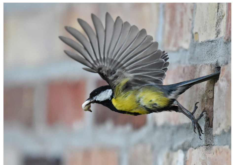
Talgoxen håller ställningarna.