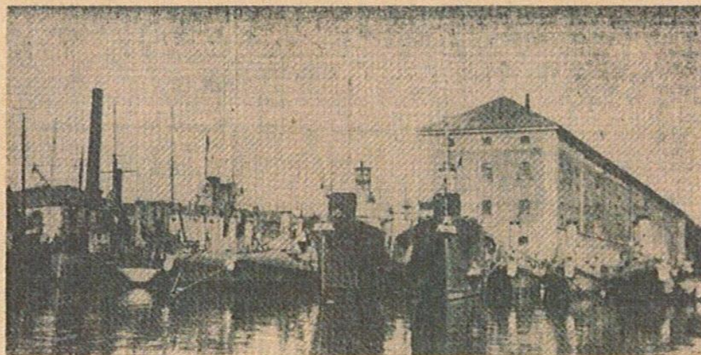
En bild från den norska flottbasen Horten, som angreps av tyskarna vid framträngandet upp genom Oslofjorden.

Enligt vad statsministern meddelat, har tyska regeringen till svenska regeringen riktat en framställning med uttalande av förväntan, att Sverige skulle iaktta strikt neutralitet. Framställningen har av svenska regeringen besvarats med ett meddelande, att den kommer att fasthålla vid den neutralitetspolitik, som den redan flera gånger under det pågående kriget deklarerat, och att den förbehåller sig full frihet att vidta alla sådana åtgärder som befinnas nödvändiga för bevarandet och försvaret av denna neutralitet.