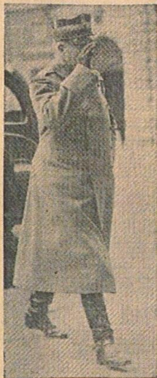
Överbefälhavaren för armén, general Thörnell, kallades på tisdagen till överläggning hos kungen. Här ses han vid Slottet på väg upp till den viktiga råd-

Sverige förbehåller sig frihet att värna sin neutralitet.